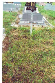
“哥哥坟上长满了草”

他以简单的英文表明了来意“我的哥哥葬在马六甲，但风水一直没有做，看到报上的新闻说你们能帮忙贫困者办理身后事，希望能帮哥哥申请关爱人间的服务，安葬在墓园里。”